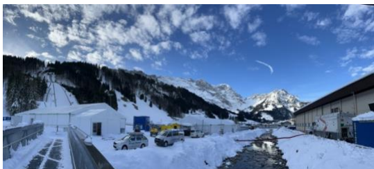
Noch herrscht emsiges Treiben im Schanzenareal – bis am Freitag für die Qualifikation ist alles bereit.