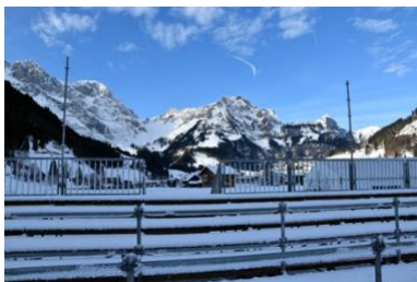
Die Zuschauertribüne ist bereit. Es gilt Zertifikatspflicht.